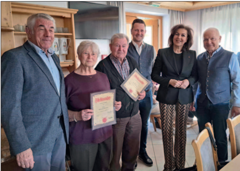
Die Geehrten für 25-jährige Treue