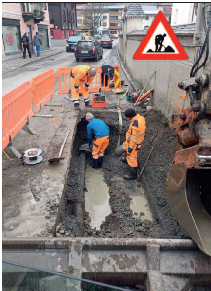
Die Bauhofmannschaft saniert den Rohrbruch der Wasserhauptleitung in der Dorfstraße