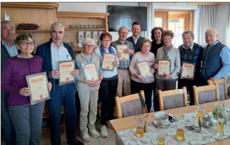
Die Geehrten für 20-jährige Treue