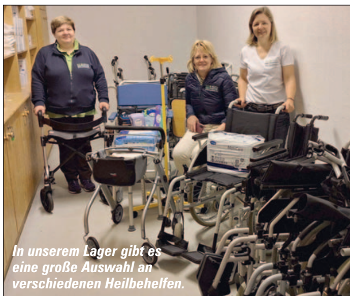
In unserem Lager gibt es eine große Auswahl an verschiedenen Heilbehelfen.

Der Sozial- und Gesundheitssprengel bietet nicht nur Pflege und Betreuung an, sondern stellt gegen eine kleine Leihgebühr auch rasch und unkompliziert verschiedene Heilbehelfe zur Verfügung. In unserem Lager haben wir Rollatoren, Roll- und Toilettenstühle, Bettgalgen, Duschhocker, Infusionsständer sowie Pflegebetten (welche dankenswerter Weise von den Gemeindevätern angeliefert werden). Wir geben auch