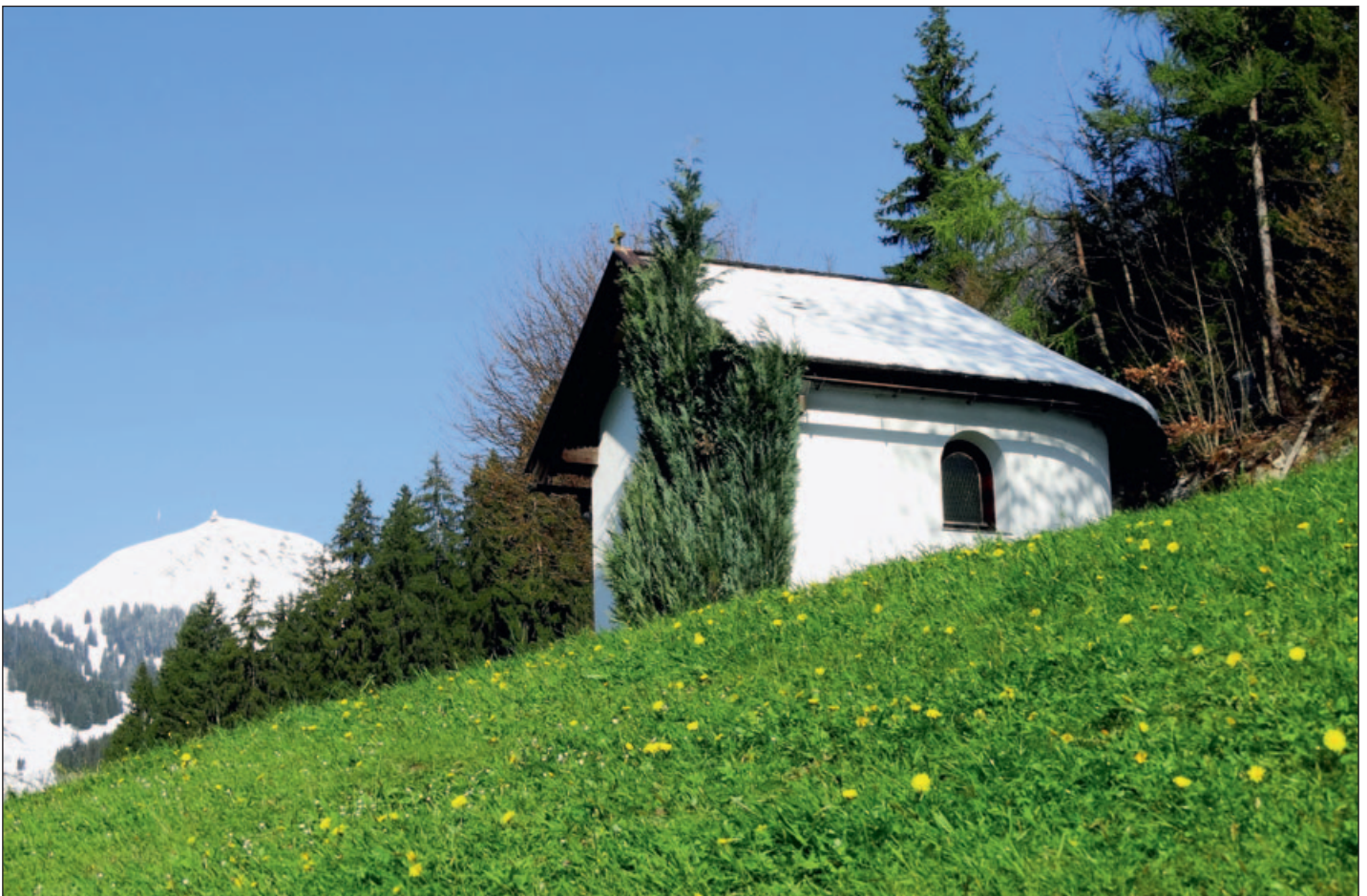
Vorderberger Kapelle